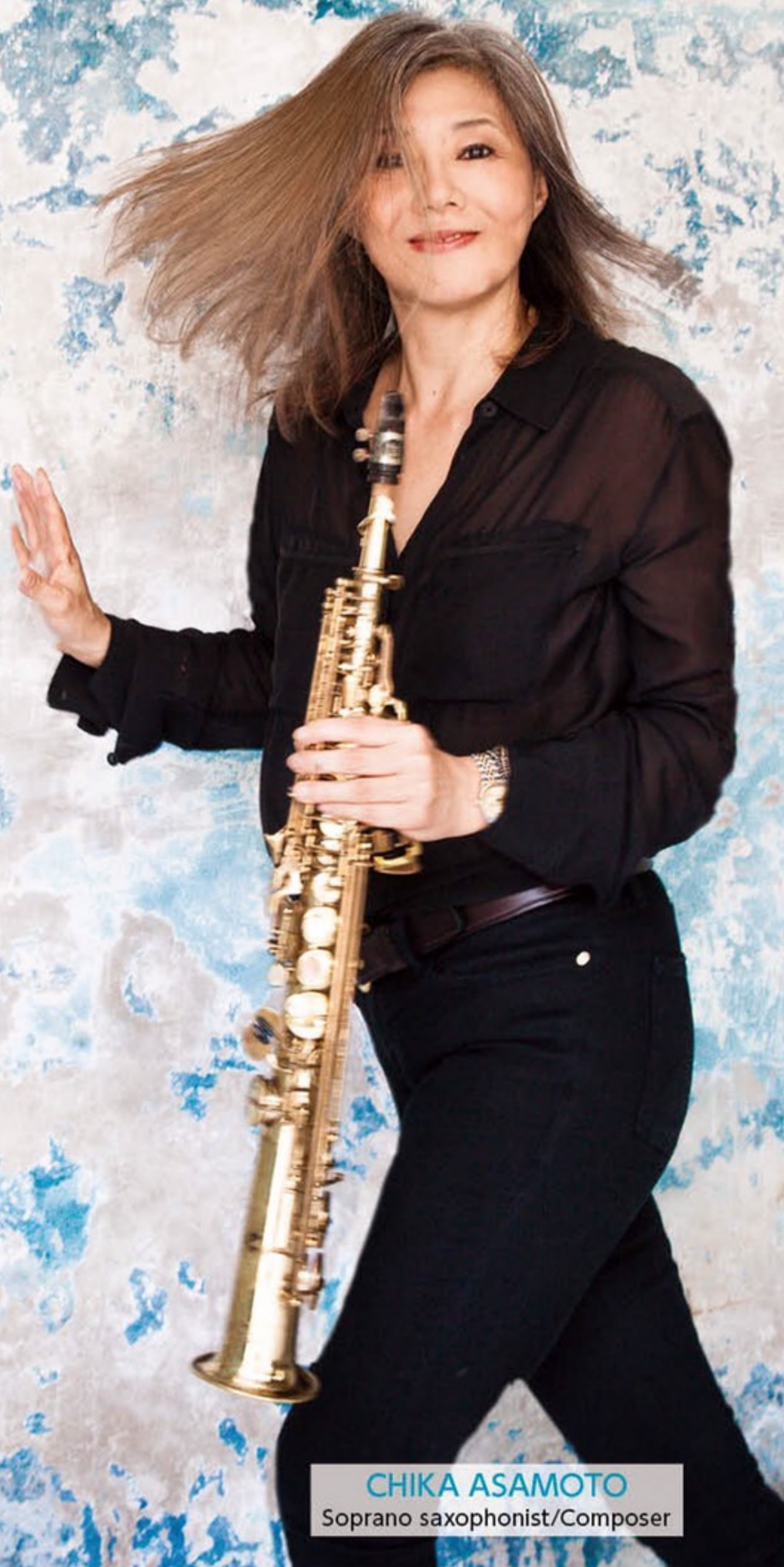
CHIKA ASAMOTO Soprano saxophonist/Composer